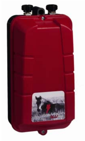
Aggregat för nätanslutning, 220 v.